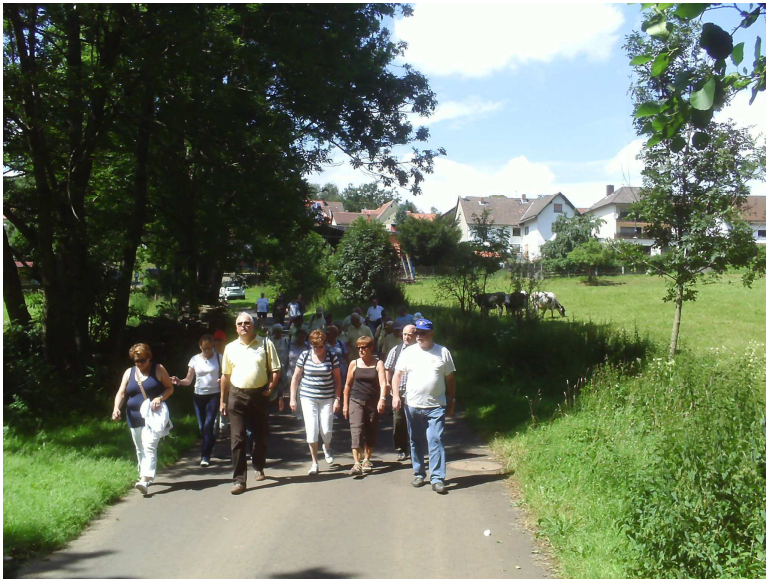
„Gut Fuß“ sind gut zu Fuß