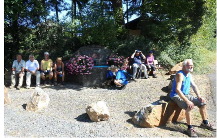
Rast am „Kammerforst“