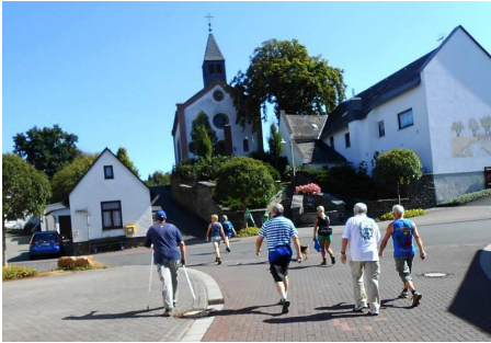
Gruppe in Niederlauken