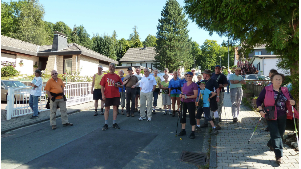
Start der geführten Wanderung